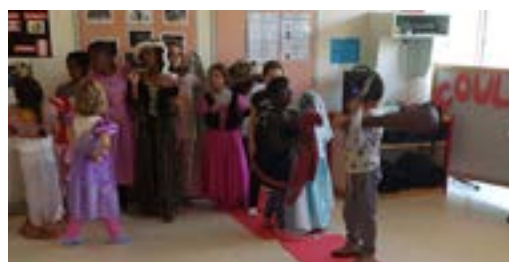
Sans oublier les temps d'expression (danse, théâtre...), C'est ça le périscolaire au Bourg.