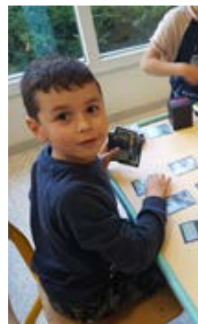
Des ateliers de création (portraits, fresques africaines), des jeux

Penser aux délais de réservation pour les centres de loisirs fixés à 6 semaines avant la période souhaitée en mairie ou depuis chez vous de votre espace famille