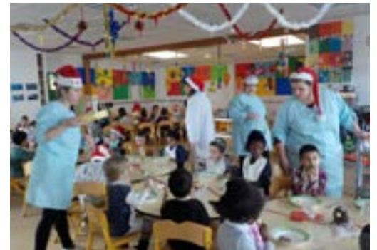
Des moments de complicité et de partage avant les fêtes de Noël...