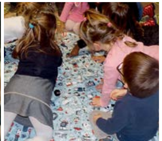
Des ateliers d'expression, d'histoires et de contes, de jeux et d'activités...