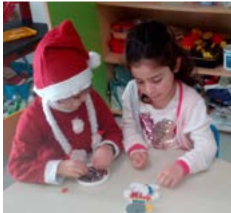
Des ateliers d'expression, de création en attendant le repas du midi...