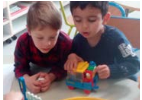
Des temps de jeux, des moments de complicité...