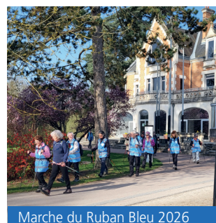
Marche du Ruban Bleu 2026

le 50-74 ans. Cette année, 250 participants ont ainsi marché sur l'un des trois parcours proposés par l'USM Saran randonnée dans le cadre de la marche du Ruban bleu. Lors de cette mobilisation annuelle, s'est également tenu le défi