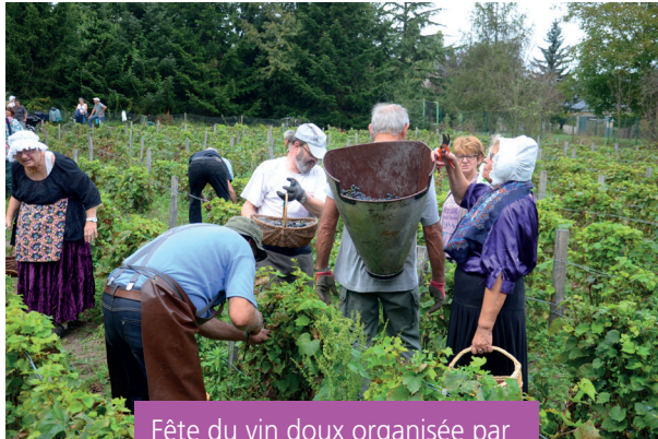
Fête du vin doux organisée par le GHL au mois de septembre.