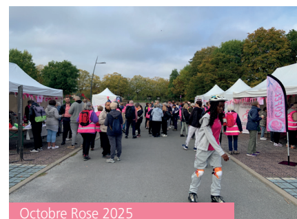
Octobre Rose 2025